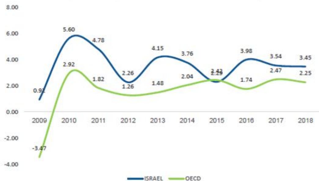
שיעור צמיחת התוצר הגולמי על פני העשור