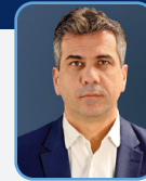
ח"כ אלי כהן שר הכלכלה והתעשייה