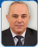
ד"ר יובל שטייניץ שר התשתיות הלאומיות, האגריגה והמים