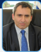
ח"כ זאב אלקין השר להגנת הסביבה