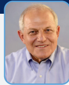
ח"כ חיים כץ שר העבודה והרווחה