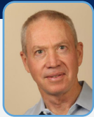
ח"כ יואב גלנט שר הבינוי והשיכון