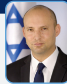
ח"כ נפתלי בנט שר החינוך