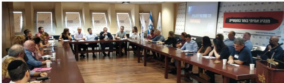
פגישה ראשונה של פורום קנאביס בהתאחדות

ההגעה של תרופות לשוק, שכן זמן המחקר והאישור קצרים מהותית. עולם מוצרי הצריכה מחפש פתרונות, וחברות שונות פונות לפיתוח מזון או תמרוקים במדינות אחרות. פעילות הפורום תתמקד גם במחקר ופיתוח במפעלים השונים בארץ בכדי שנוכל לייצר קרקע נוחה ומהירה לייצור ושיווק מוצרי צריכה מבוססים על רכיבי הקנאביס מיד כשהיו מותרים במדינות השונות." א