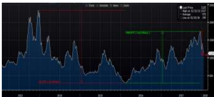
מדד BDI (Baltic Dry Index)