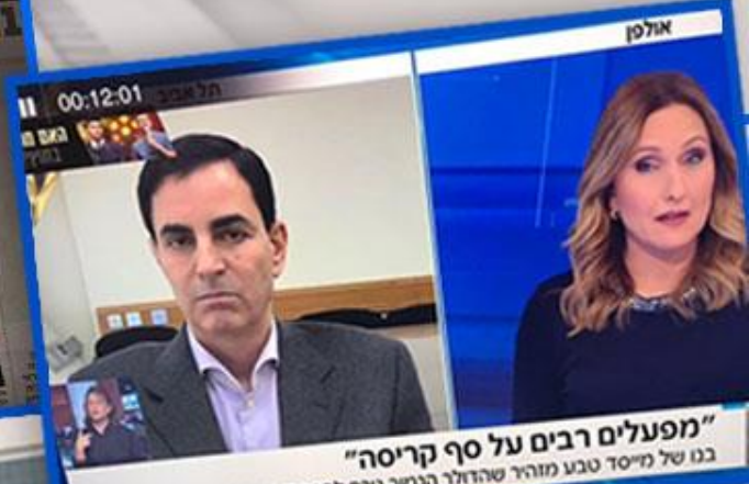
”מפעלים רבים על סף קריסה” בנו של מיידט טבע מזרח שהדולר הנמוך גרם להפסדי עתק לתעשייה בישראל