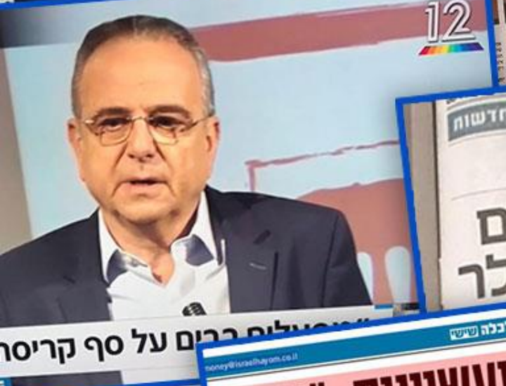
מפעלים רבים על סף קריסה