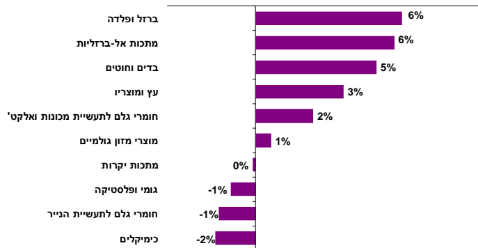
התפתחות יבוא חומרי הגלם במשק לפי קבוצת סחורות שיעורי שינוי ריאליים, ממוצע חודשי אפריל-יולי 2013 לעומת ממוצע חודשי Q1/13, מנוכה עונתיות

העלייה ביבוא חומרי הגלם משקפת גידול ביבוא מרבית קבוצות הסחורות לתעשייה ונגזרה בעיקרה מגידול ביבוא חומרי הגלם לתעשיית המכונית והאלקטרוניקה (2%), הברזל והפלדה (6%). זאת לצד, גידולים מהירים גם ביבוא מתכות אל-ברזליות (6%), בדים וחוטים (5%).