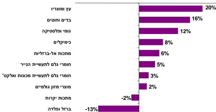
שיעורי שינוי ריאליים, Q2/11 לעומת Q1/11

ההאטה בקצב גידול יבוא חומרי הגלם משקפת האטה בקצב גידול יבוא גומי ופולסטיקה (12%), חומרי גלם לתעשיית המכונות והאלקטרוניקה (3%) ולתעשיית הנייר (5%), לצד נסיגה ביבוא ברזל ופלדה (-13%) ומתכות יקרות (-2%). מנגד, האצה נרשמה בקצב גידול יבוא עץ ומוצריו (20%), בדים וחוטים (16%), כימיקלים (8%), ומתכות אל-ברזליות (6%), לצד גידול מחודש ביבוא מוצרי מזון גולמיים (2%).