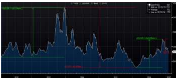
מדד BDI (Baltic Dry Index)