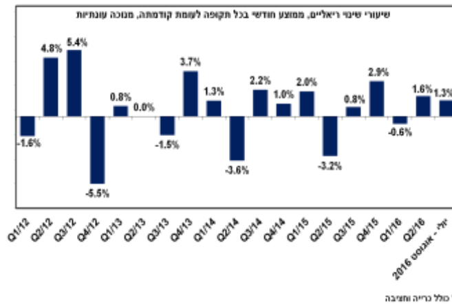
התפתחות התוצר התעשייתי*

בחדשים יולי - אוגוסט 2016 נמשכה הצמיחה בתוצר התעשייתי: צמיחה של כ- 1.3% לעומת הרבע השני של השנה, זאת בהמשך לעלייה של כ- 1.6% ברבע השני של 2016.