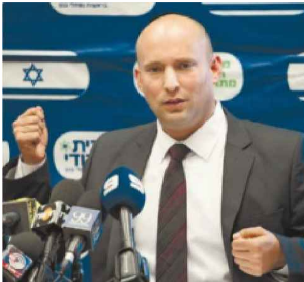
נפתלי בנט