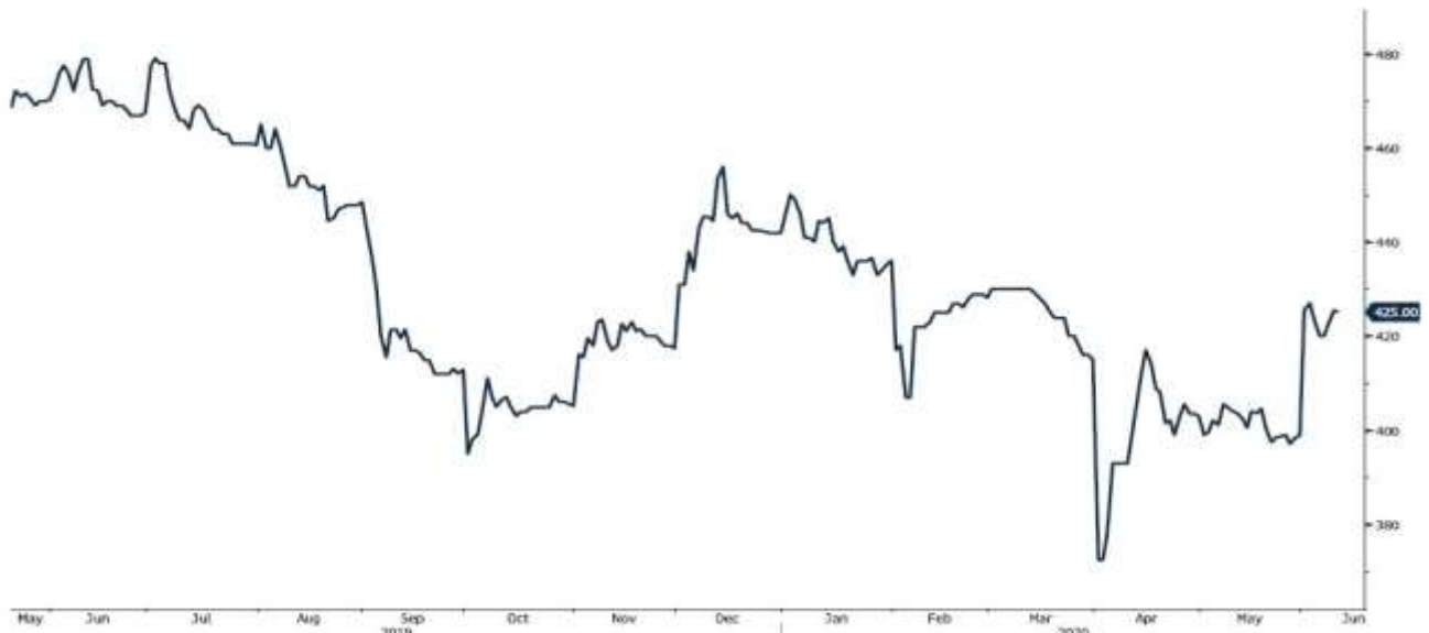
JBP1 Comdty (Generic 1st 'JBP' Future)